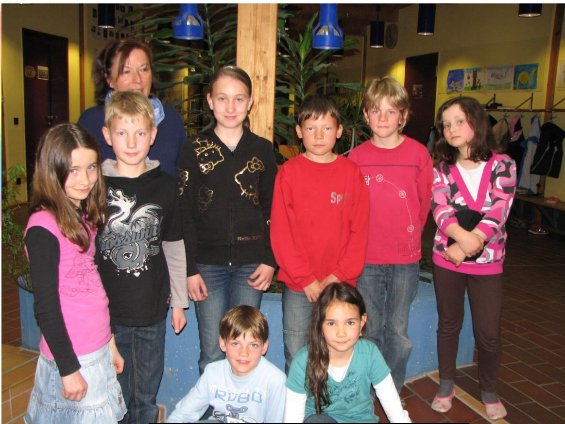
Schülerparlament, im Mai 2010

Unser Ziel ist es, dass unsere Schülerinnen und Schüler lernen, selbstständig, planvoll und sorgfältig zu arbeiten - sowohl allein als auch im Team. Sie sollen eigenständige Ideen und Lösungswege entwickeln, darstellen und überprüfen.